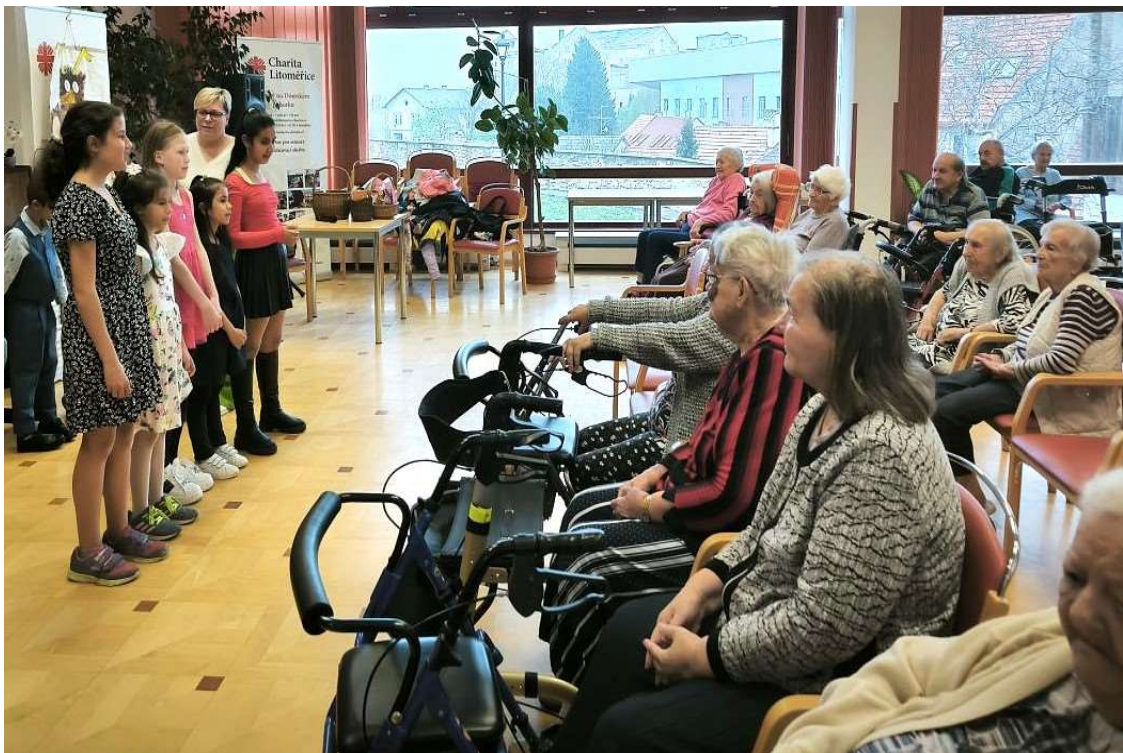
Vánoční vystoupení v Domově seniorů na Dómském pahorku