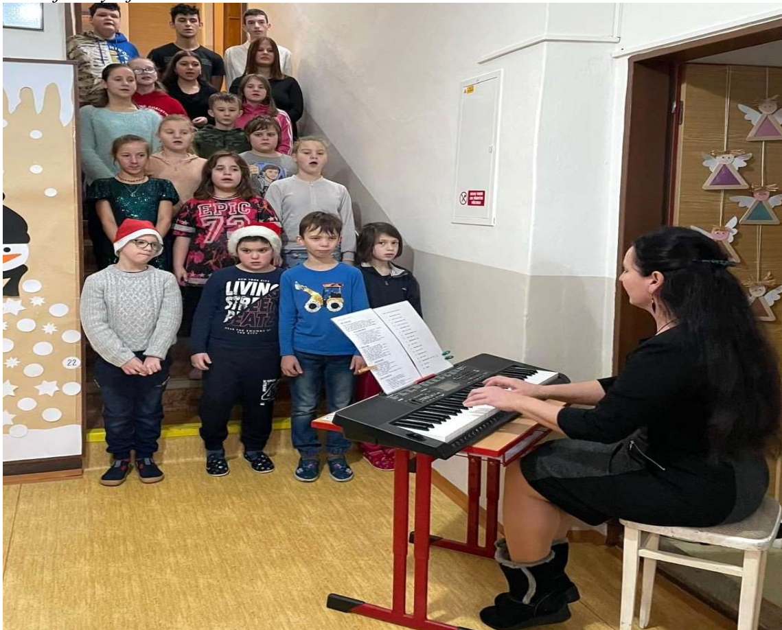
Zpívání na schodech v Úštěku