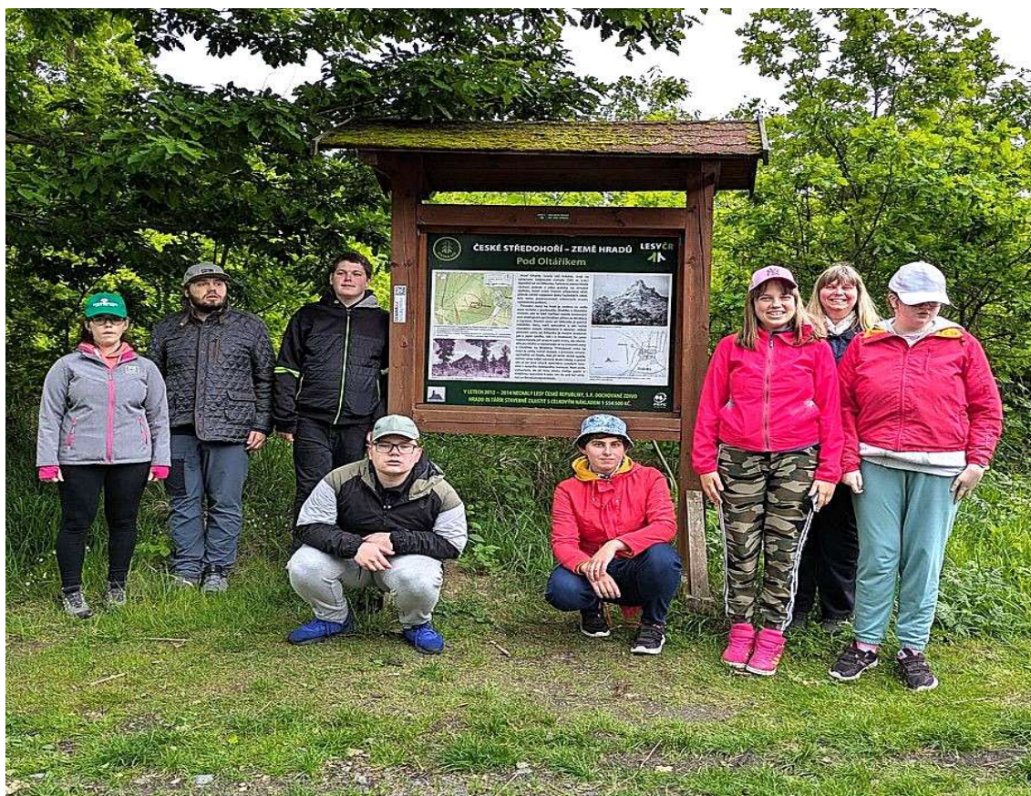
Stezkou hradů – výlet na Oltářík