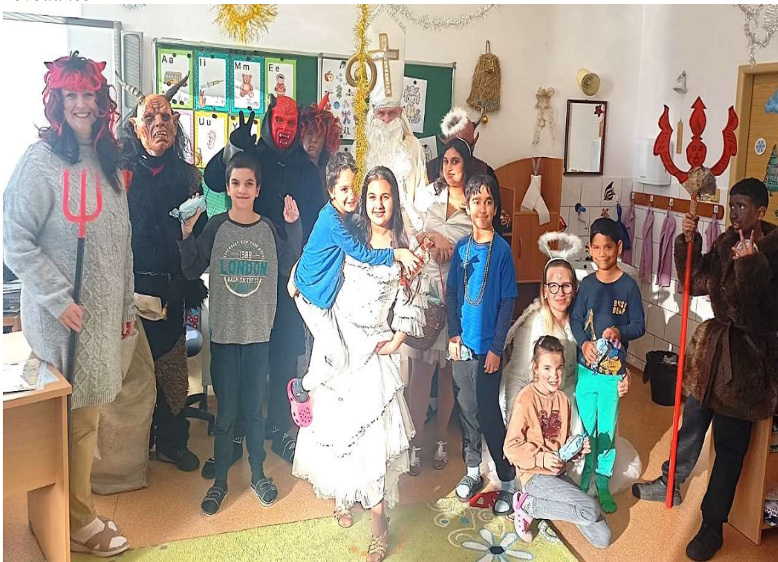
Mikulášská nadílka v Lovosicích