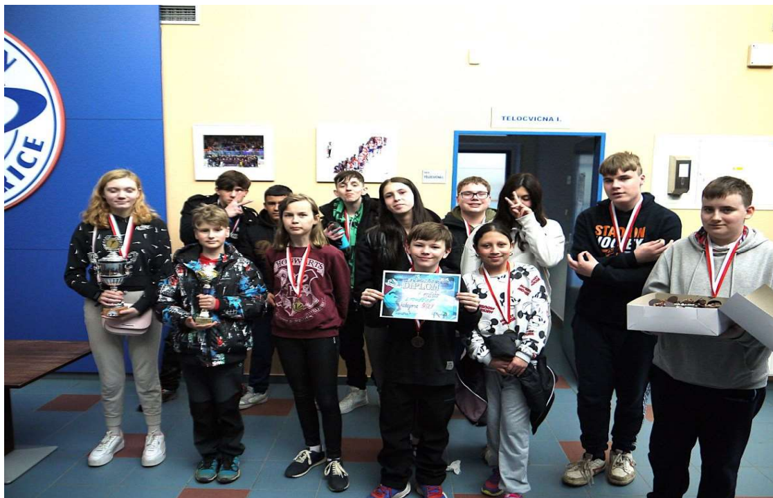
Nejrychlejší bruslař – vítězný tým