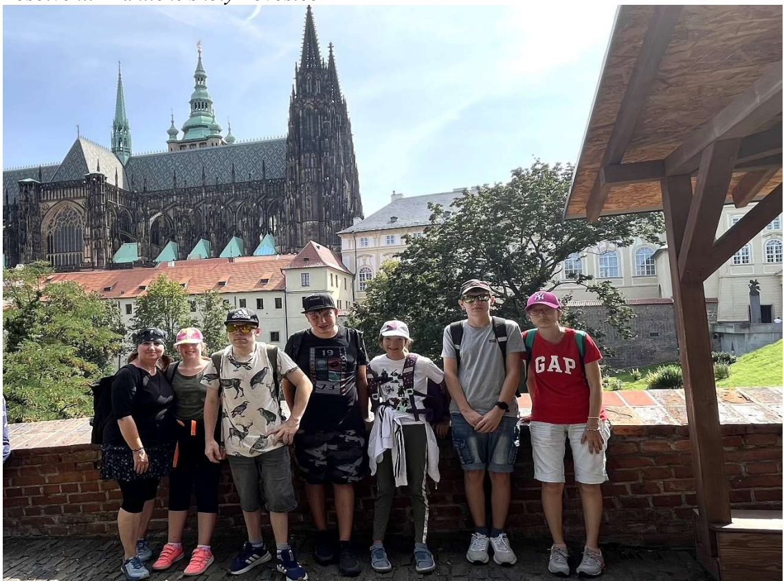
Praha – Vyšehrad