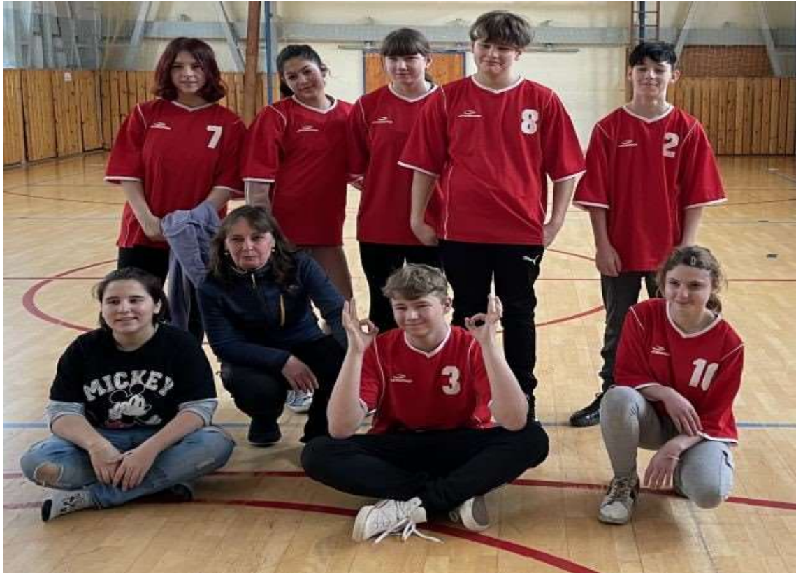
Turnaj ve vybíjené