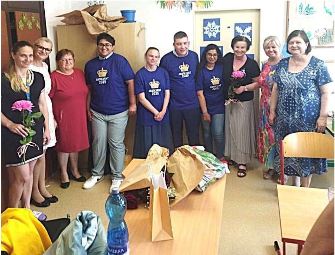
Absolventi Praktické školy Lovosice