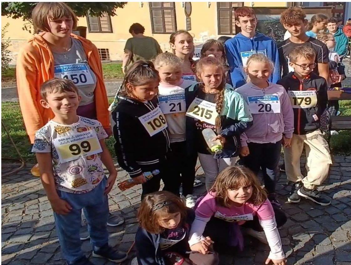
Běh po úštěckých schodech