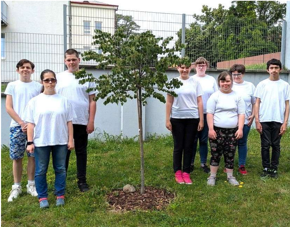
Žáci praktické školy pečují o lípu zasazenou při 10. ročníku turnaje v CzeBumBalu